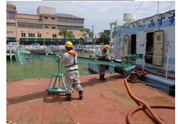
みずすましアオコ回収