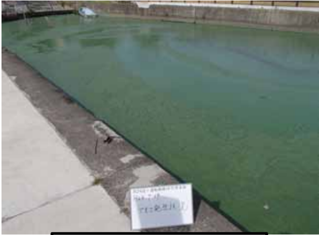
作業船によるアオコ攪拌作業