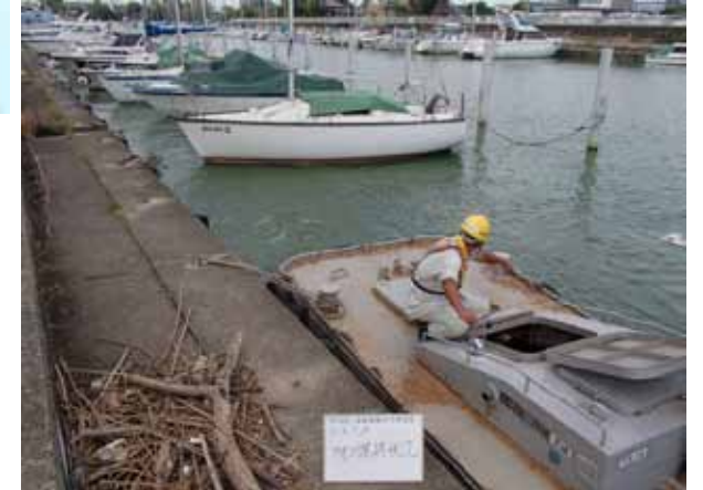
作業船によるアオコ攪拌作業