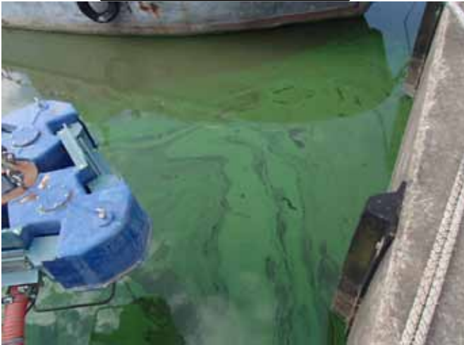
作業前アオコ発生状況