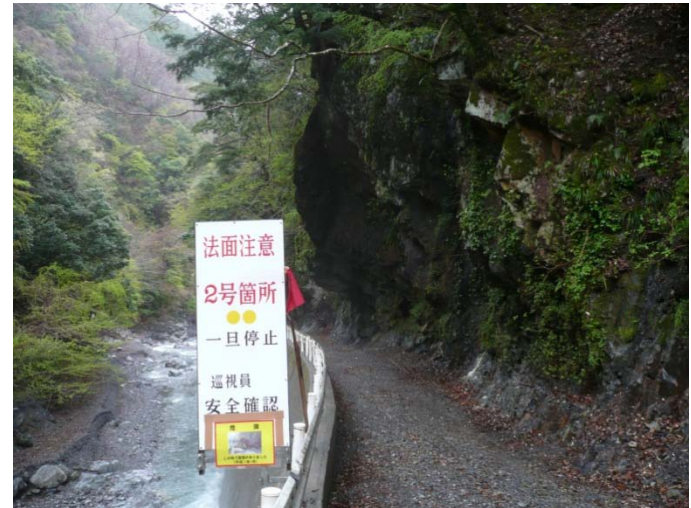
保川 落石注意看板設置