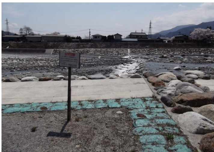
大武川第50床固 注意喚起看板再設置