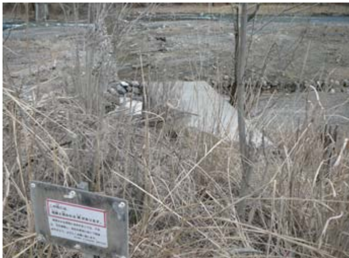
貉窟第2床固 注意喚起看板再設置