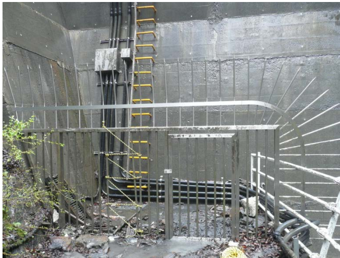
稲又第3砂防堰堤 立入禁止柵破損部封鎖