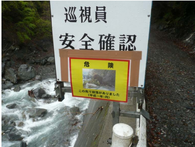
保川 落石注意看板設置