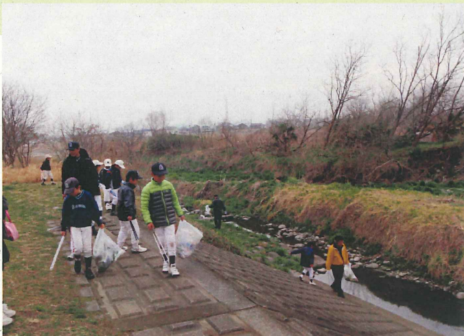
国立クリーン作戦（11月）

多摩川におけるクリーン作戦は、例年沿川自治体の皆様の多大なご協力により実施されており、多摩川の環境美化に大きく貢献する行事となっております。