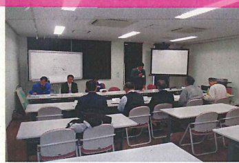
鶴見川合同分科会 ↑