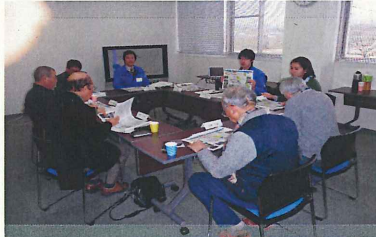
多摩川上流分科会 ↑