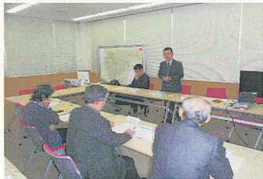
多摩川下流分科会 ↑