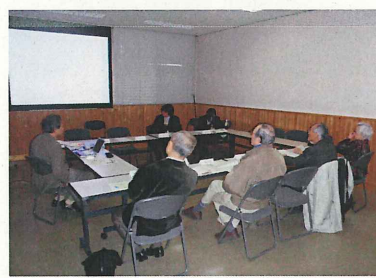
多摩川中流分科会 ↑