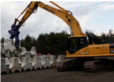
無人緊急減災対策工施工訓練(国土交通省)