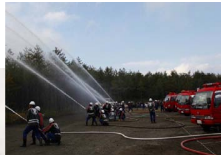
山林火災消火訓練(群馬県・嬬恋村)