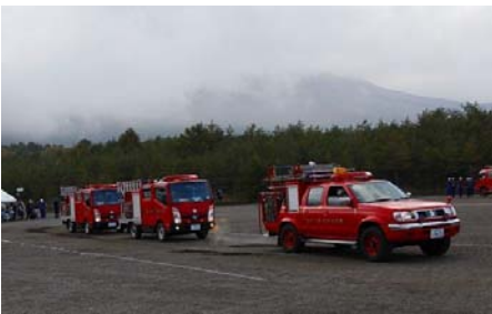
注意情報広報訓練(嬬恋村)

注意情報広報訓練(避難準備情報伝達・広報車による広報) 道路規制訓練(国道交通規制・町道林道通行禁止・入山禁止) 緊急減災対策工施工訓練(ブロック積砂防堰堤施工 無人) 山林火災消火訓練(防災ヘリによる空中散水・消防団による放水)