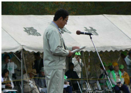
連絡会議会長 茂木御代田町長講評・挨拶