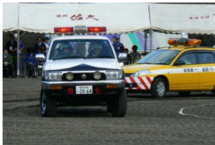
道路規制訓練(群馬県)