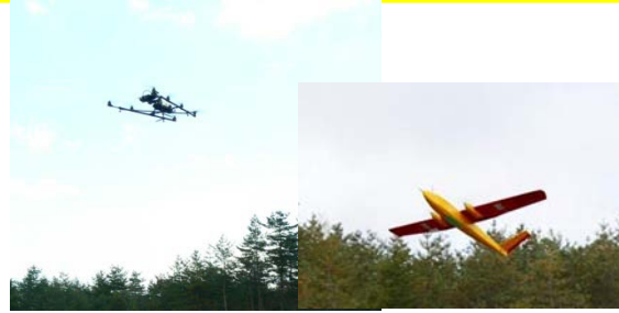
無人飛行機写真撮影訓練(国土交通省)