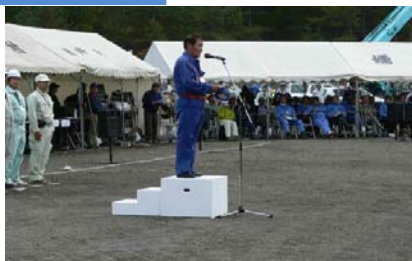
開催地 熊川嬭恋村長挨拶