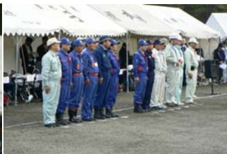
訓練役員・参加者