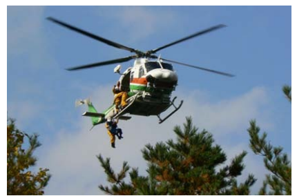
あおぞら号画像伝送訓練(国土交通省)