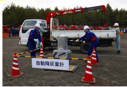
降灰量計設置訓練(国土交通省)