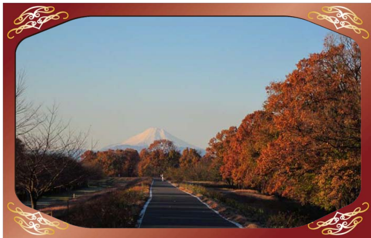
川越水上公園 (入間川) より