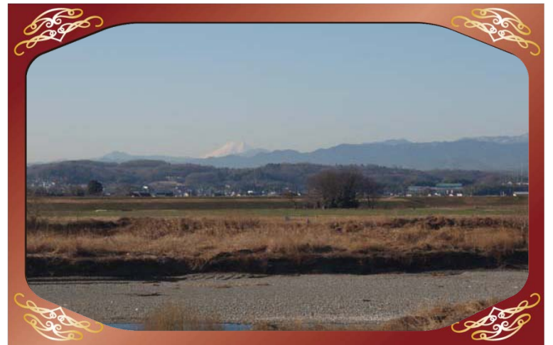
旧久下冠水橋（荒川）より