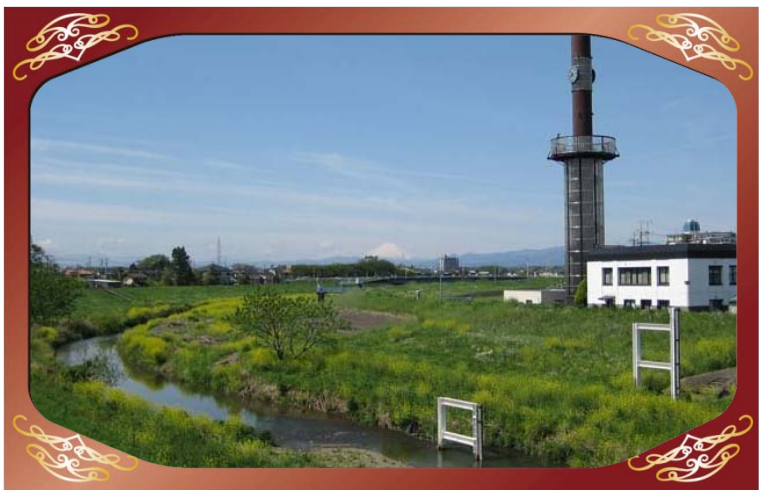
八幡橋（小畔川）より