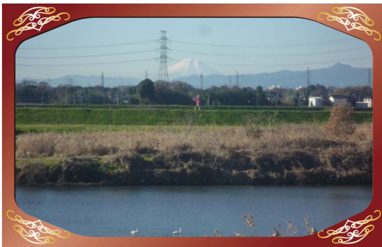
川島町吹塚地先（越辺川）より