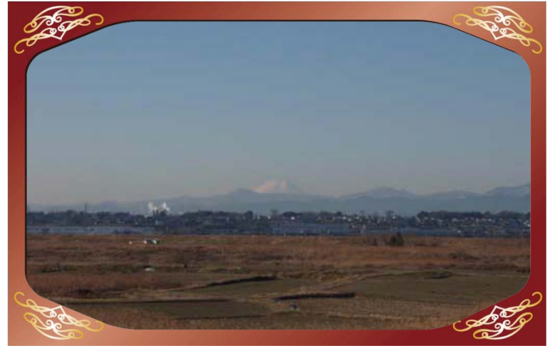
パノラマ公園（荒川）より