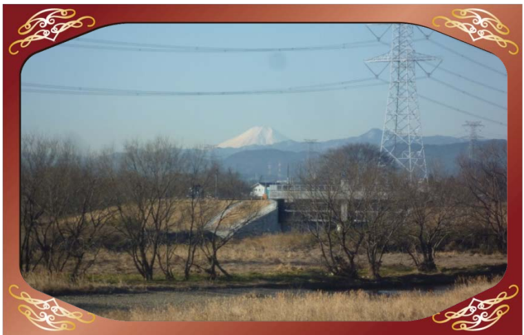
葛川水門付近（越辺川）より