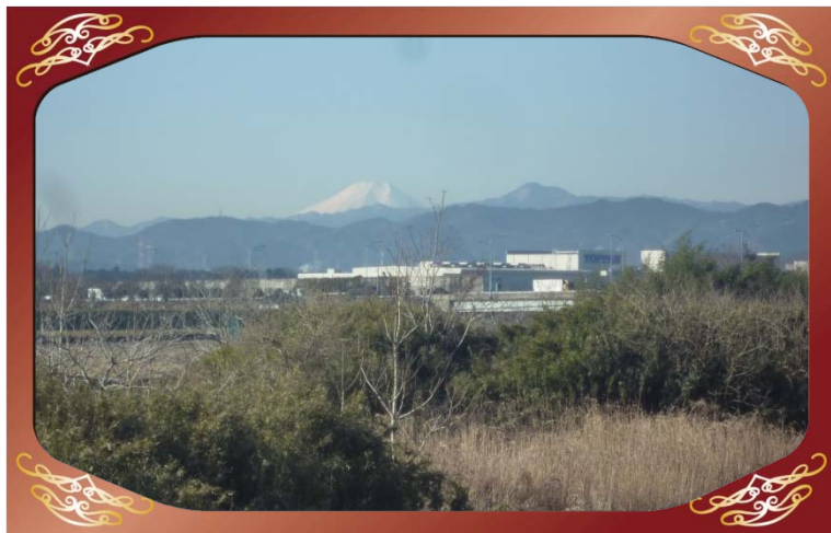
樋ノ口橋上流（越辺川）より