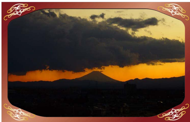
川越市小堤地先 (小畔川) より