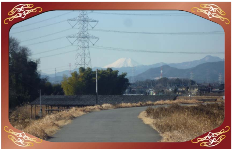
坂戸市浅羽地先（高麗川）より