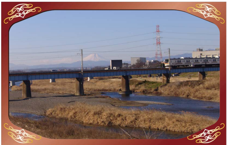
川越市小ヶ谷地先 (入間川) より