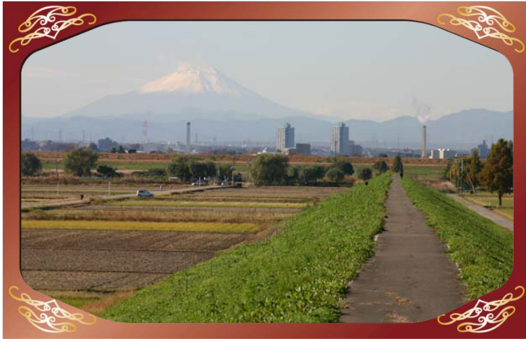
東京健康保険組合運動場下流付近（荒川）より