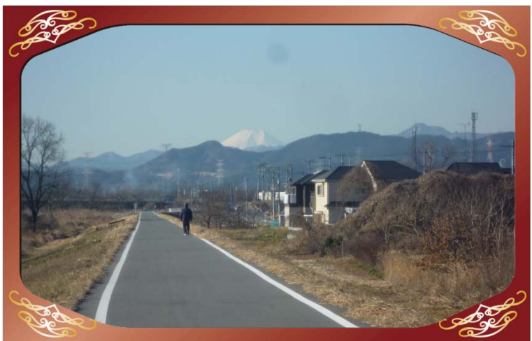
坂戸市萱方地先（高麗川）より