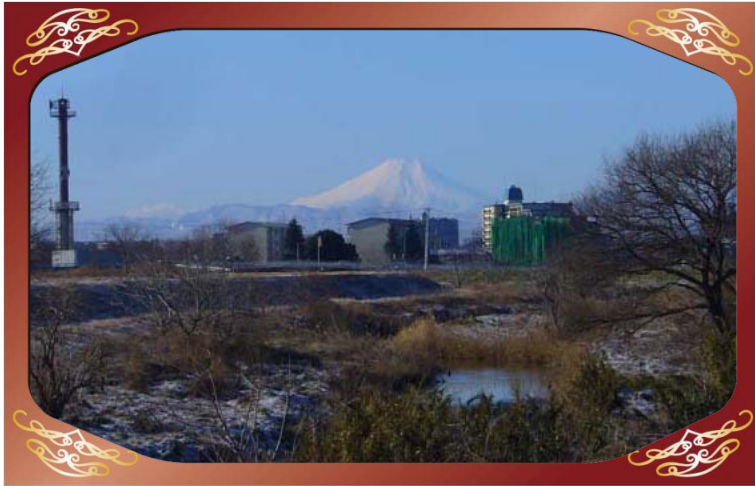
川越市下小坂地先（小畔川）より