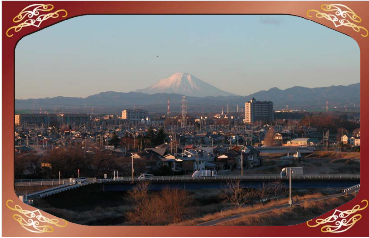
川越市小堤地先（小畔川）より