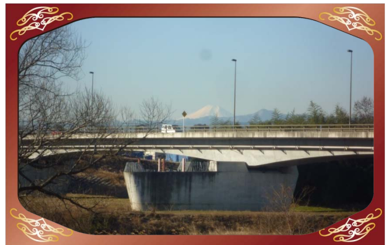
新松山橋付近（都幾川）より