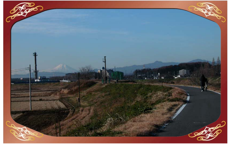
川越市鯨居地先（小畔川）より