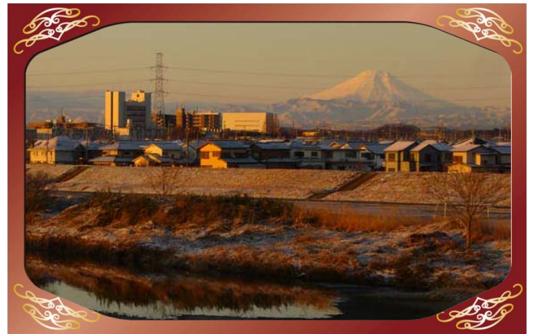
川越橋（入間川）より