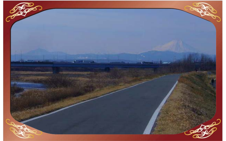
川越市の場地先（入間川）より