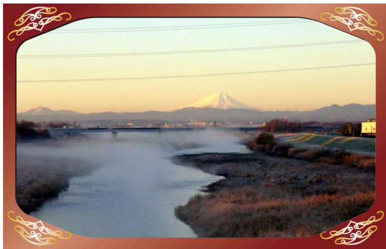
初雁橋（入間川）より