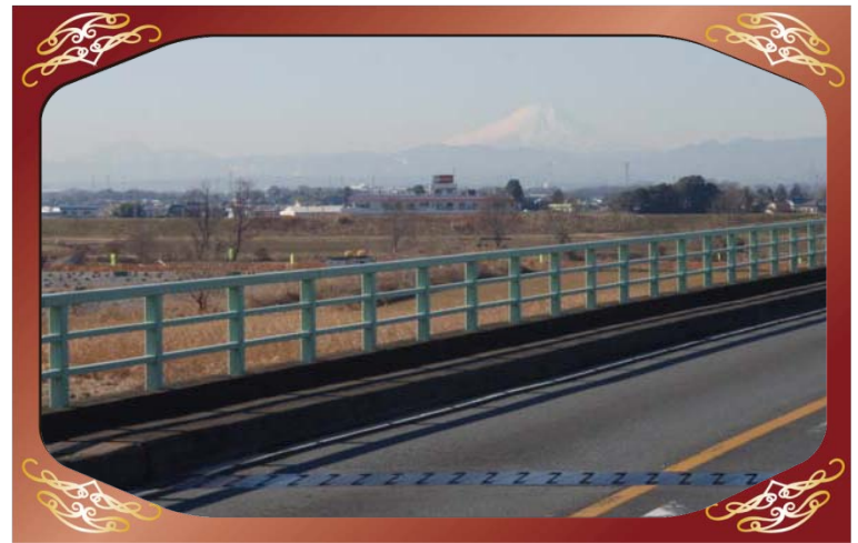
太郎右衛門橋（荒川）より