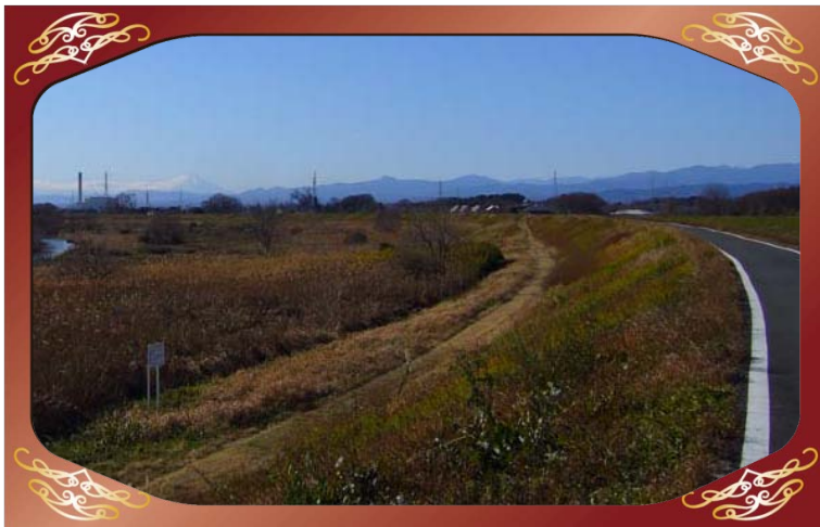
川越市福田地先（入間川）より