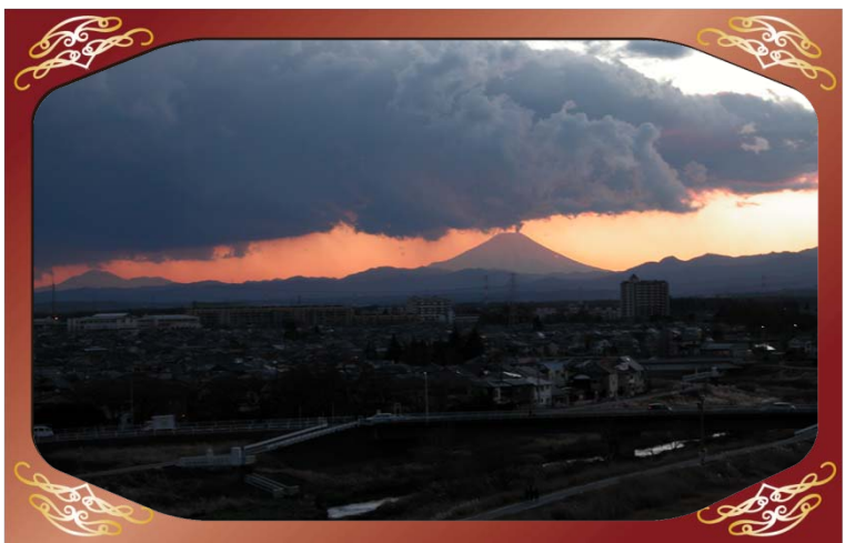
川越市小堤地先 (小畔川) より