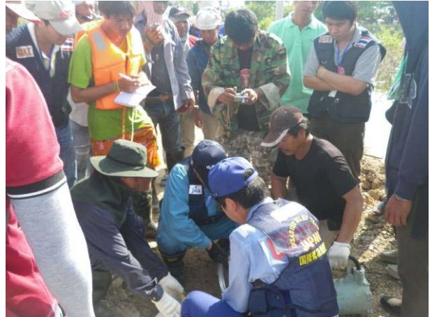
現地作業員への指導