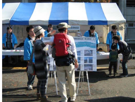
パネルを使用しての広報