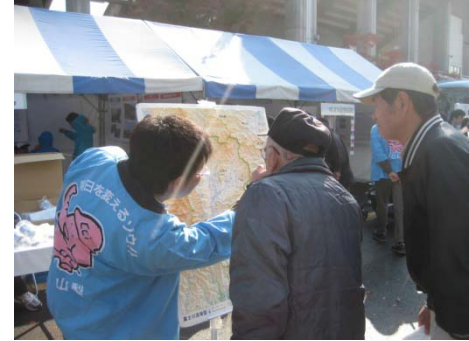
立体地図を使用しての広報