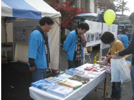
パンフレットの配布