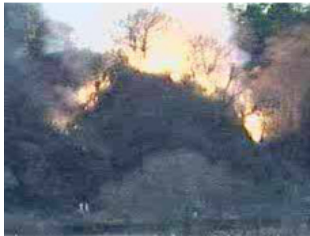
火災後の状況／CCTVカメラ (平成23年1月17日多摩川)