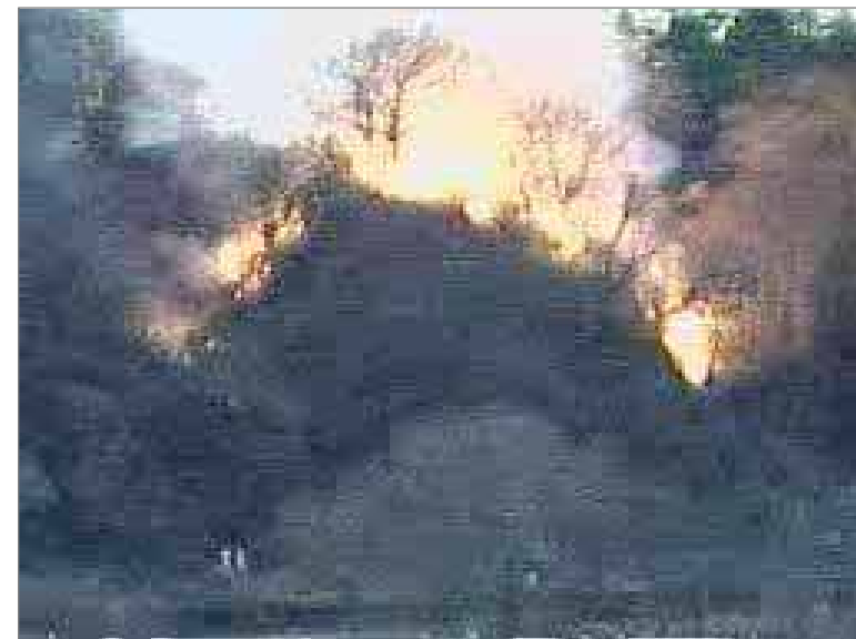
火災後の状況 / CCTVカメラ(H22年1月17日多摩川)