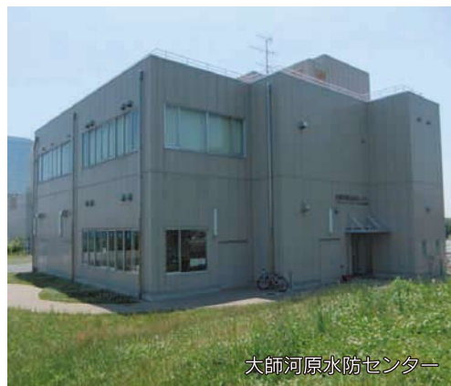
大師河原水防センター