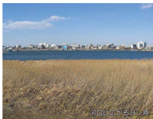
河口に広がるヨシ原