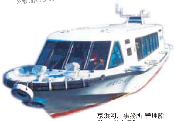
京浜河川事務所 管理船 “けいひん号”