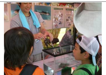
モスガコに興味津々。