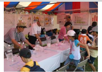
水質のお勉強です