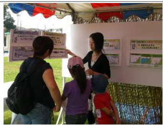
京浜河川の多摩川クイズ