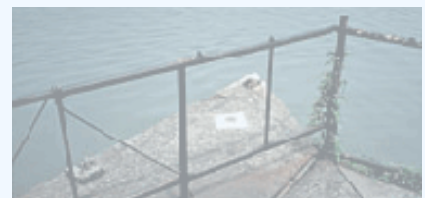
多摩川河口原点（左岸）