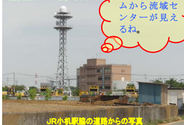
JR小机駅脇の道路からの写真