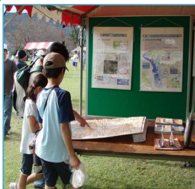
甲府河川国道事務所展示ブース