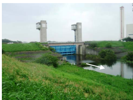
↑ 9月2日 水門の開操作を実施