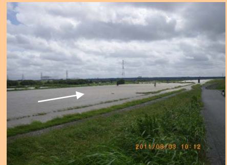
↑ 9月3日 江戸川(玉葉橋上流)