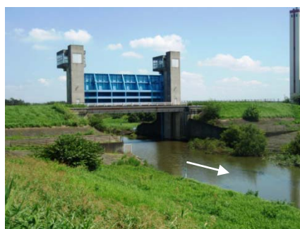
↑ 9月7日 水門の開操作を実施

利根川と江戸川をつなぐ利根運河の最上流部には運河水門という施設があり、平常時は開いた状態となっています。