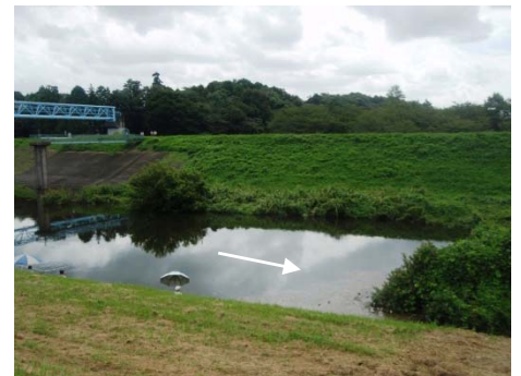
↑ 利根運河 流山市西深井地先 河岸状況