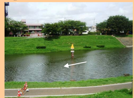
↑ 9月3日 利根運河(流山市西深井)