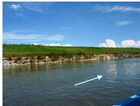
↑ 江戸川 野田市今上地先 護岸状況