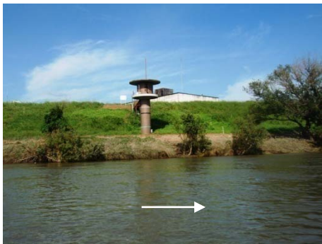
↑ 江戸川 野田市中野台地先 河岸状況

そのため、水位が下がった段階で、堤防の護岸や河岸が被害を受けていないか、河川巡視船等からの目視による巡視を行い、異常がないことを確認しました。