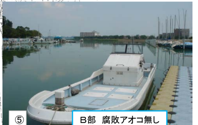
⑤ B部 腐敗アオコ無し