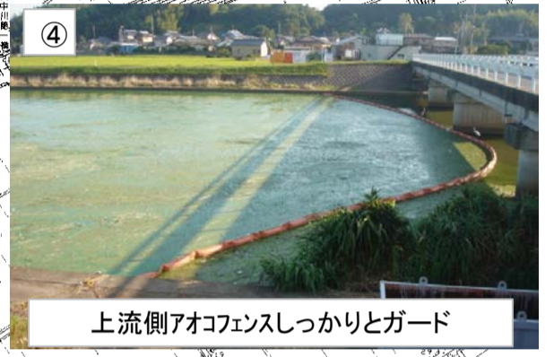
上流側アオコフェンスしっかりとガード