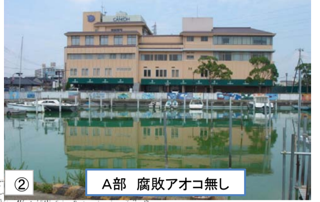
② A部 腐敗アオコ無し