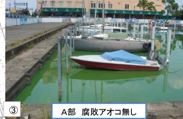
③ A部 腐敗アオコ無し