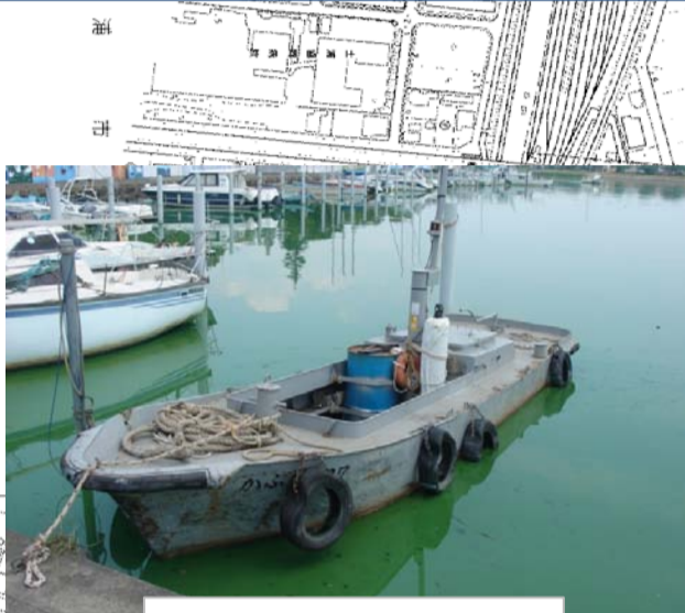
攪拌に使った交通船