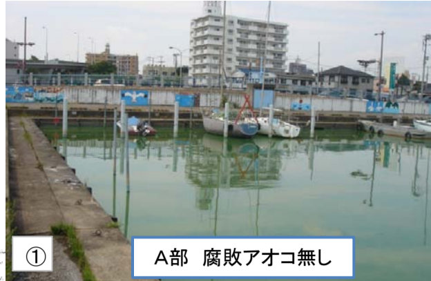
① A部 腐敗アオコ無し