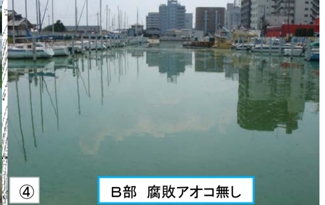
④ B部 腐敗アオコ無し