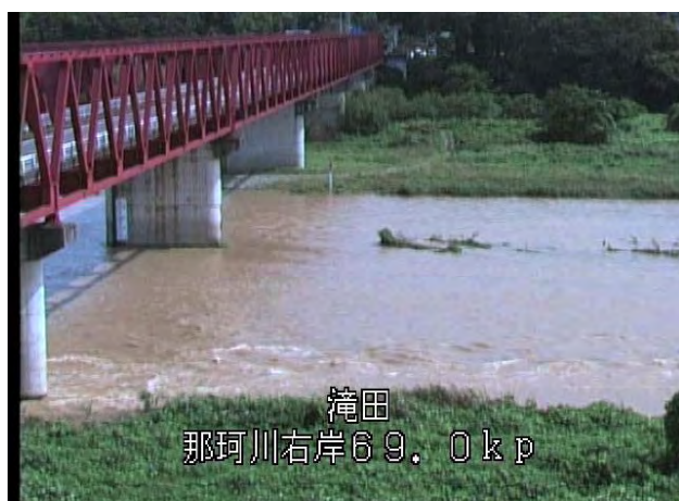
平成23年9月4日10時 撮影