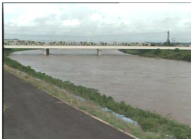
平成23年9月4日10時 撮影