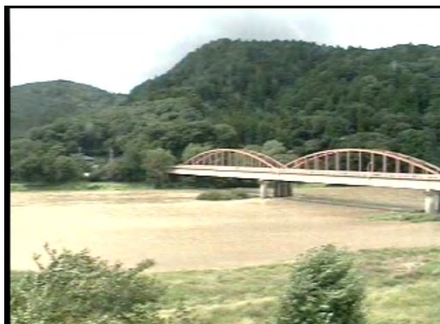
平成23年9月4日10時 撮影