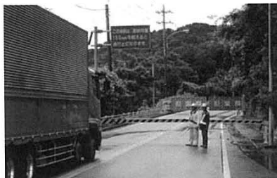
【古屋敷】通行規制状況

〈事前通行規制区間について〉 台風などの大雨の際にあらかじめ 定めた規制雨量※に達すると、道路 利用者の安全を確保するため通行 止めを行う区間です。 ※通行止めを行う降雨量の基準のことであり、 規制区間ごとに、連続雨量(降り始めから の雨量を合計し高さで表したもの)で定めて います。