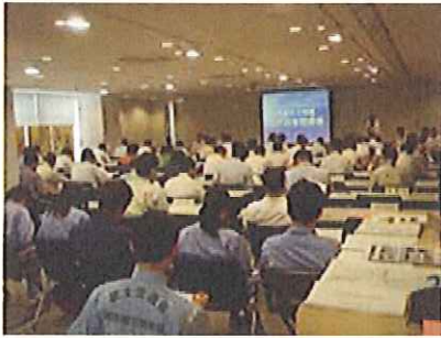
↑ 江戸川水防部会開催状況

江戸川の水防に関わる関係者で、今年度の重要水防箇所の確認、情報の伝達系統の確認等を行いました。