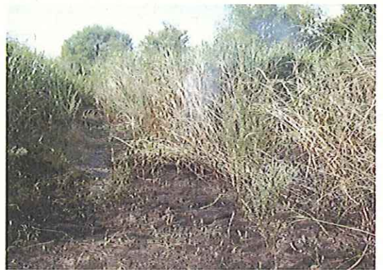
江戸川高水敷の火災(H23.7.15)