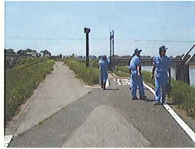
↑ 徒歩による点検の状況

堤防の異常(裸地化、滑り、陥没、変形等)を把握する目的で、事務所職員が管理区間の堤防の点検を行いました。