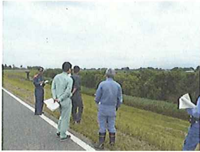
↑ 6月14日 江戸川左岸、利根運河を実施