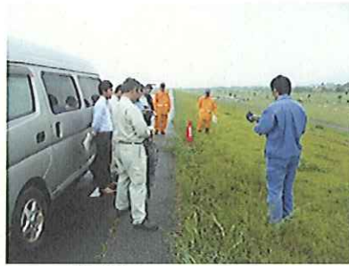
↑ 6月17日 江戸川右岸を実施

出水時に適切な水防活動が行えるよう、水防管理団体である関係市・水防団及び県の防災関係者等と、河川の状況や重要水防箇所の点検・確認を行いました。