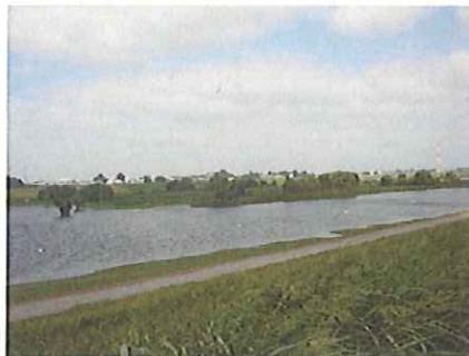
江戸川高水敷の冠水状況(H23.7.21)

これからが、台風シーズン本番です。江戸川河川事務所では、洪水に備え様々な点検や準備を行い安全に努めます。河川が増水しているときは、危険ですので川に近づかないようにしましょう。