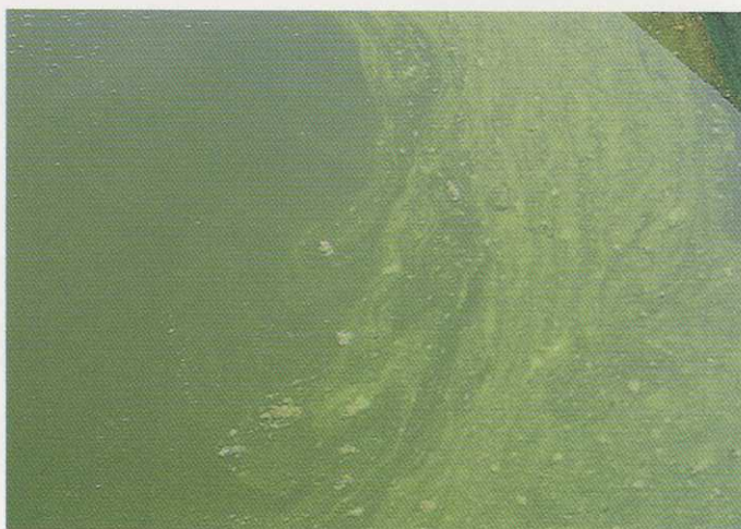
レベル4：膜状にアオコが湖面を覆う。