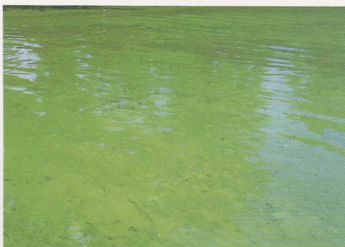
レベル5：厚くマット状にアオコが湖面を覆う。