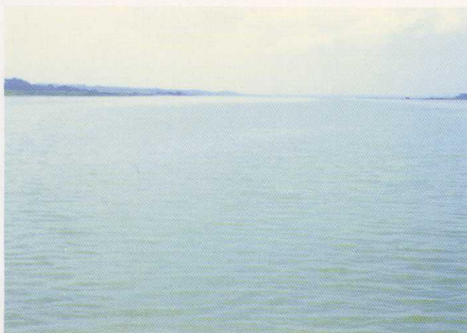
レベル1：アオコの発生が肉眼で確認できない。 (ネットで引いたり、白いバットに汲んで良くみると確認できる)