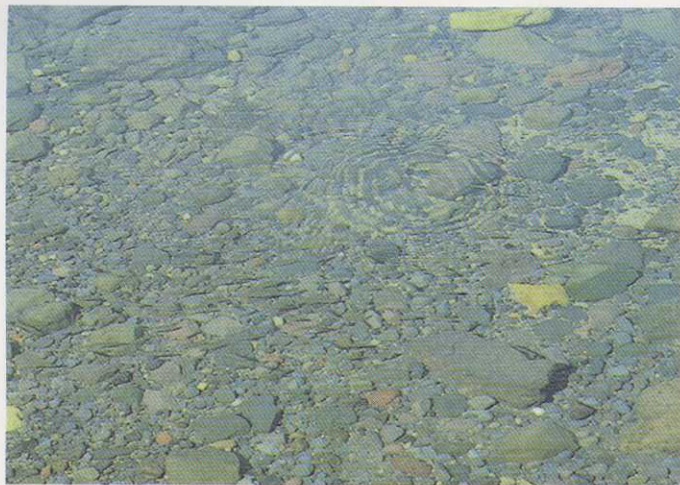
レベル0：アオコの発生は確認できない。