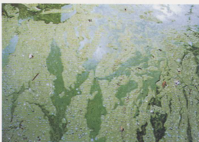
レベル6：アオコがスカム状(厚く堆積し、表面が白っぽくなったり、紫、青の縞模様になることもある)に湖面を覆い、腐敗臭がする。