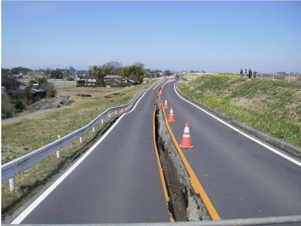
被災状況写真：被災状況 川裏（宅地側）堤防法崩れ 延長L=200m