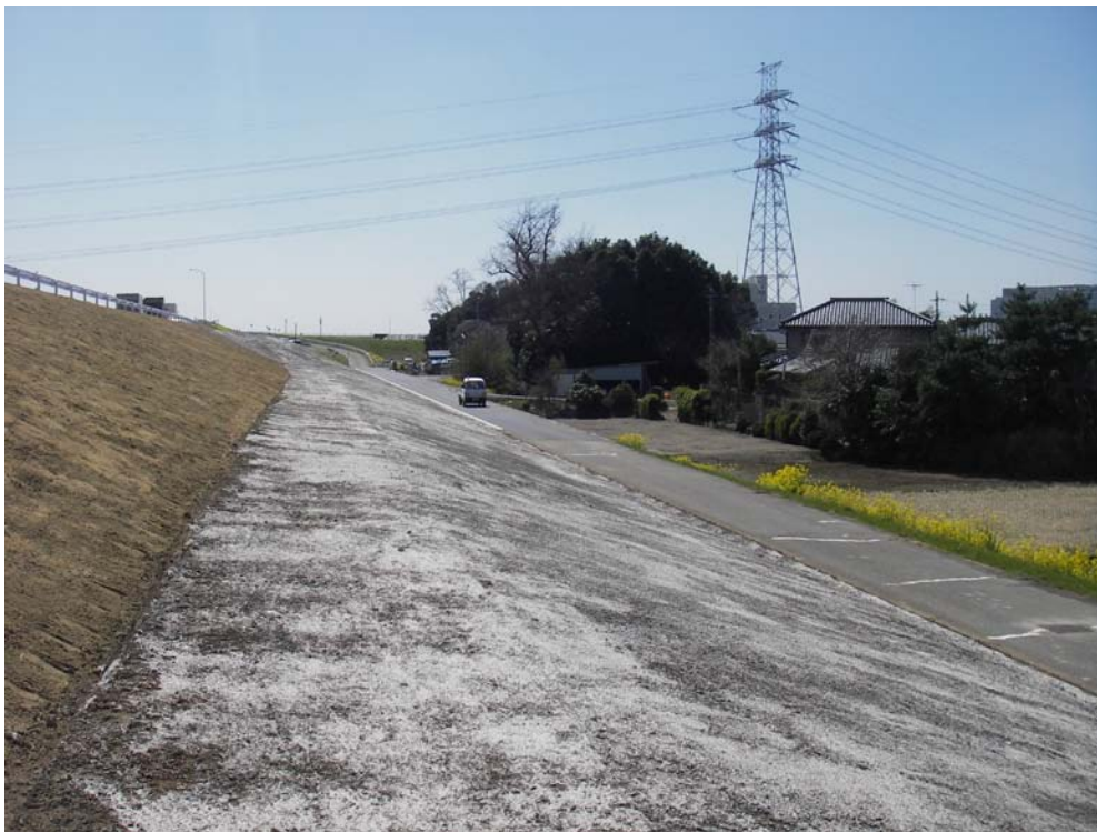
工事完成：H23. 4. 7 緊急復旧工事完成