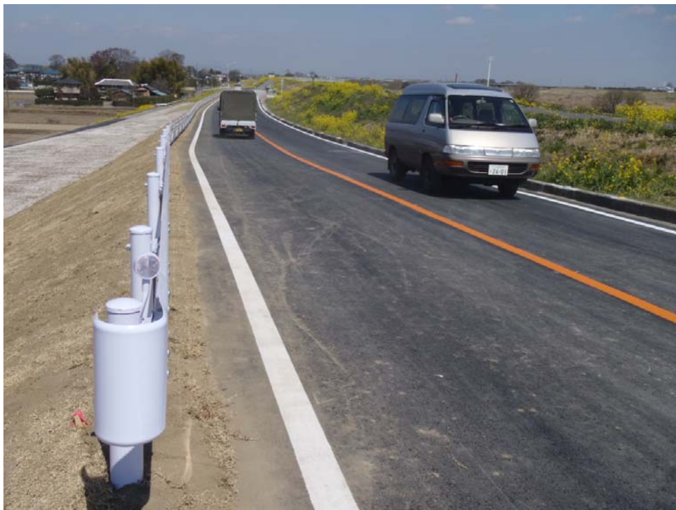
工事完成：H23. 4. 7 緊急復旧工事完成