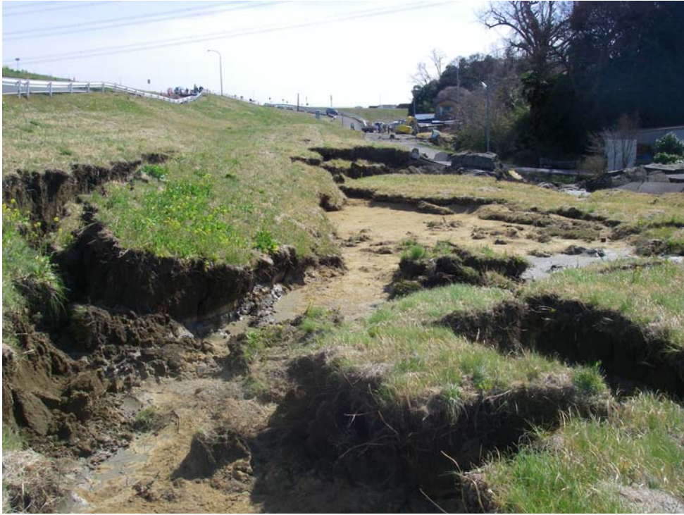
被災状況写真：被災状況 川裏（宅地側）堤防法崩れ 延長L=200m