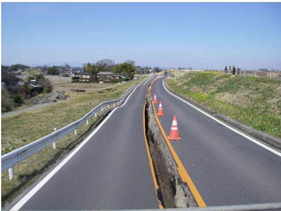
被災状況写真：被災状況 川裏（宅地側）堤防法崩れ 延長L=200m