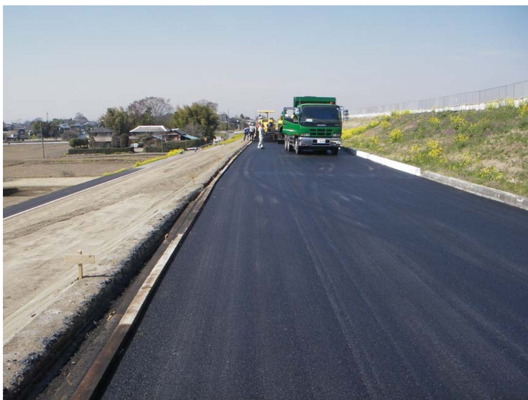
現況写真：工事実施状況 H23. 4. 1 進捗率92%