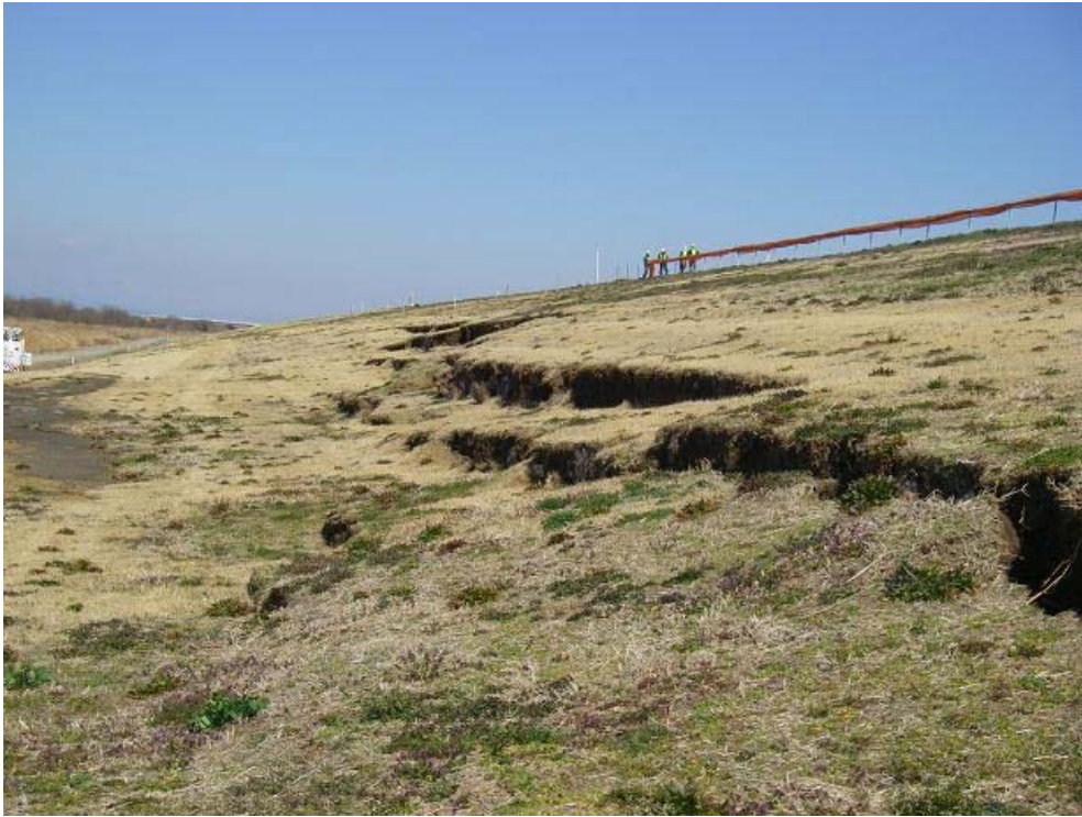
被災状況写真：被災状況 川表（川側）堤防法崩れ 延長L=230m