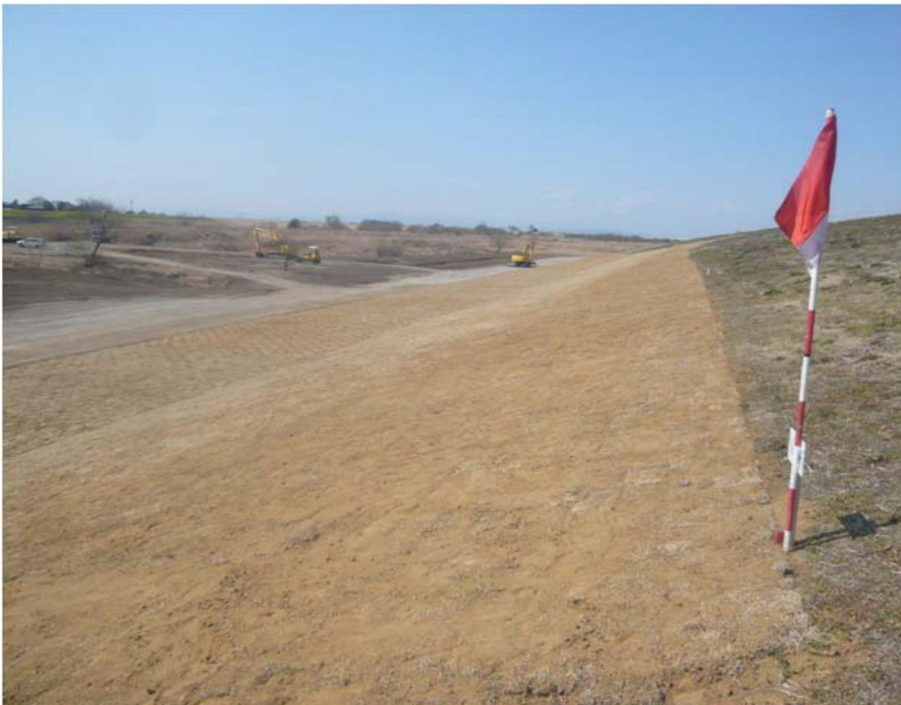
完了写真：H23. 3. 29 緊急復旧工事完了