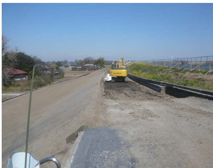
現況写真：工事実施状況 H23.3.28 まで 進捗率 86%