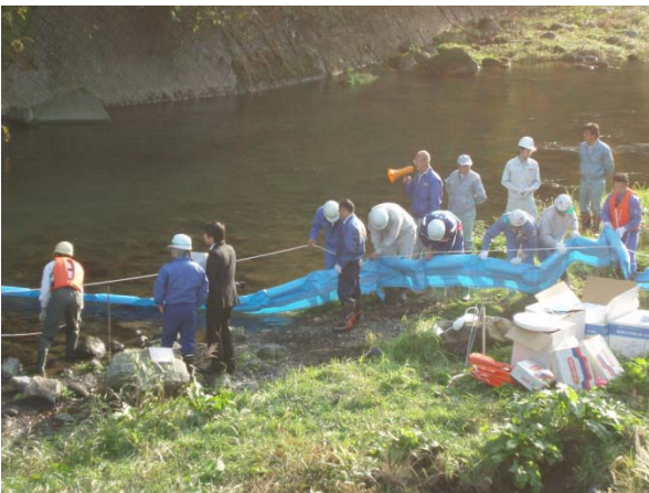
③油流出事故対策（オイルフェンス設置）