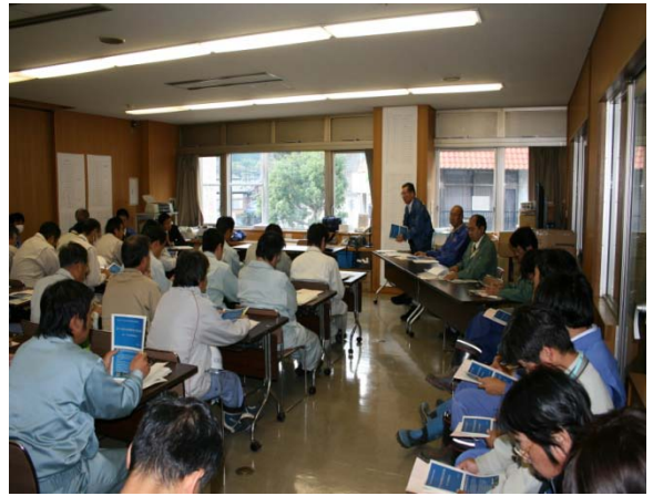
②専門講師による講習