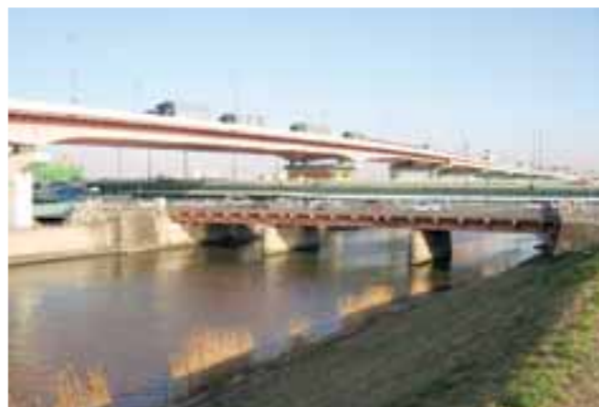
冬でも水量は変わらない