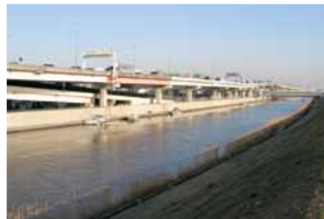
奥に見えるのが四ツ木小橋

◇緊急連絡先：本田消防署南綾瀬出張所 住所：葛飾区東堀切2-28-25 電話：03(3604)0119