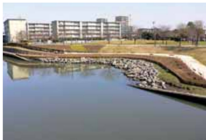
ラグーン。水際で遊べます。