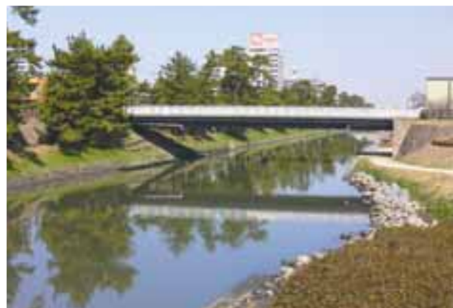
遊歩道沿いの松並木

◇緊急連絡先：草加市消防本部消防署 住所：草加市神明2-2-2 電話：048(924)2111