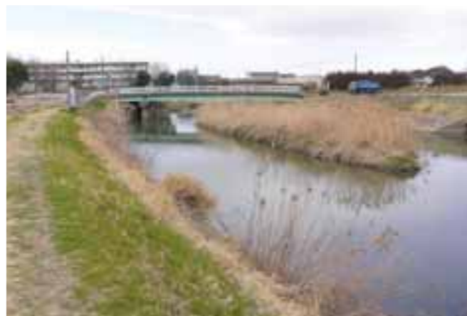
非かんがい期。橋の手前にはワンドがあります。