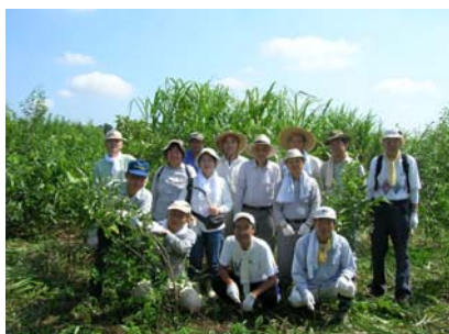
参加者の皆様（試験地②）