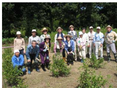
参加者の皆様（試験地③）