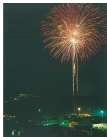
7月 笛吹川花火大会