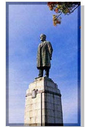
根津嘉一郎翁の銅像