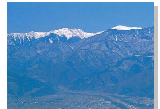
12月 信玄堤からの南アルプスの山々