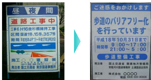
新しい路上工事看板

今後、「現場見える化プロジェクト」では、事業目的を主体とした表現に改善する等により、道路ユーザーにわかりやすく、工事目的を正しく理解いただける現場を目指します。