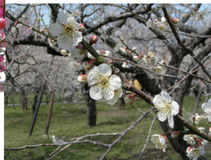
図 5-16 春の偕楽園（平成18年3月）