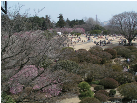
好文亭からの園内の様子