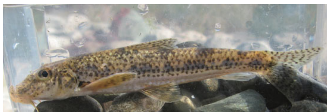
カマツカ（コイ科）

荒川にはアユ、ウグイ、オイカワ、カマツカなどが生息している。周辺の水田の用水路にはシマドジョウ、ホトケドジョウが見られ、全国的にも珍しくなったメダカも報告されている。また、夏になるとゲンジボタルやヘイケボタルが飛ぶ。