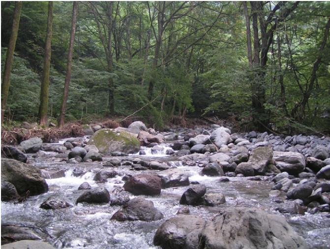
尚仁沢の湧水（平成17年9月）

高原山は奈良時代から山岳信仰の対象となり、信者たちが高原山に登拝する際、この尚仁沢（昔は精進沢とも伝えられた）の湧水で身を清めたと伝えられている。湧水量は日量