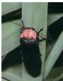
ゲンジボタル（ホタル科）