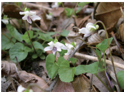
ツボスミレ（スマレ科）

手入れの行き届いた雑木林とその周辺には、カタクリ、クサボケ、ニガナ、フデリンドウ、スマレ類等の里山の植物がみられる。また、オオタカ、サシバ、ヤマセミなどの希少な鳥類も確認されている。