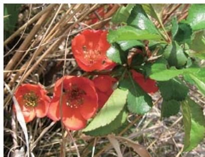
クサボケ（バラ科） （写真：榎日水コン）