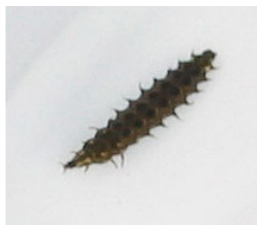
ヘイケボタルの幼虫