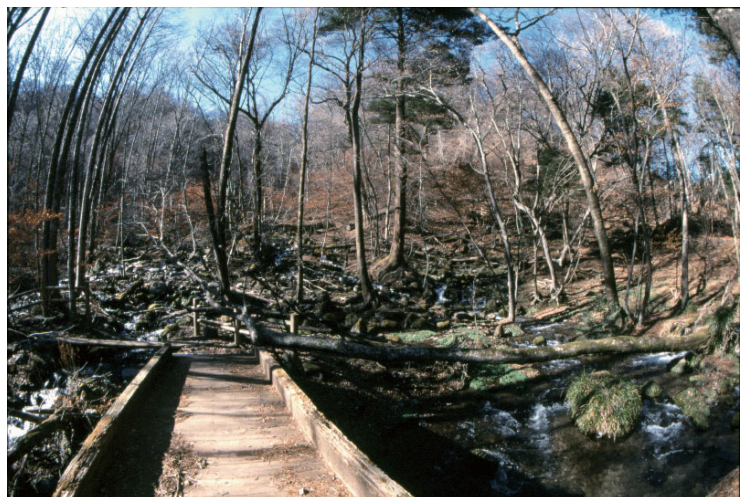
冬でも水が凍結しない沢

65,000m 3 と豊富であり、水温も年間通じて11℃前後とほぼ一定で、冬でも凍結することがない。水質は天然アルカリイオン水で、冷たく軟らかいのが特徴である。