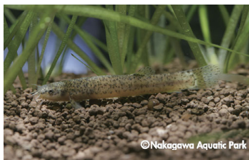
ホトケドジョウ（ドジョウ科）