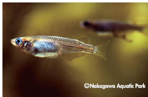
メダカ（メダカ科）