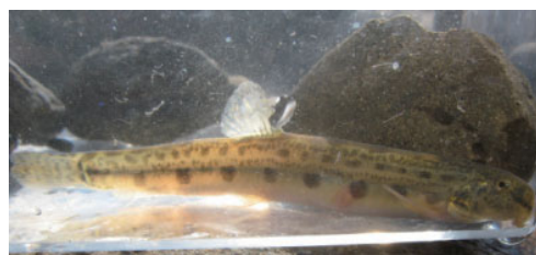
シマドジョウ（ドジョウ科）