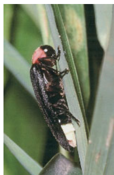
ゲンジボタルの光る様子