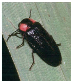
ヘイケボタル（ホタル科）