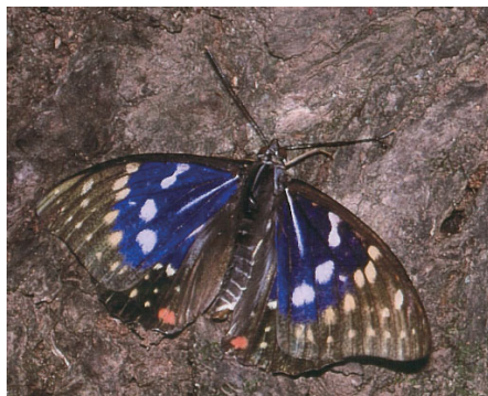
オオムラサキ (タテハチョウ科)