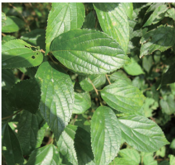
エノキ (ニレ科) (ゴマダラチョウ・ オオムラサキの食草)