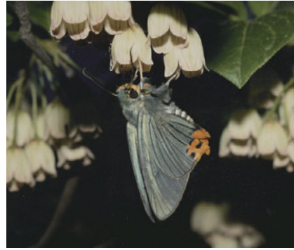
アオバセセリ (セセリチョウ科)