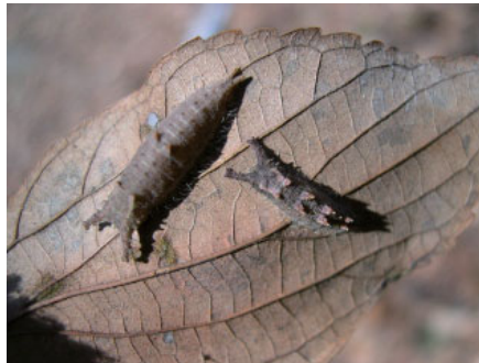
ゴマダラチョウの越冬幼虫 (左) とオオムラサキの越冬幼虫 (右)