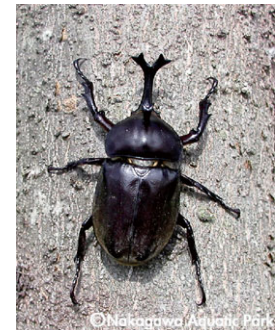
カブトムシ (コガネムシ科)