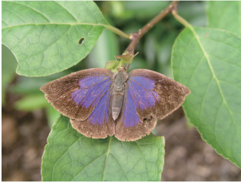
ムラサキシジミ (シジミチョウ科)