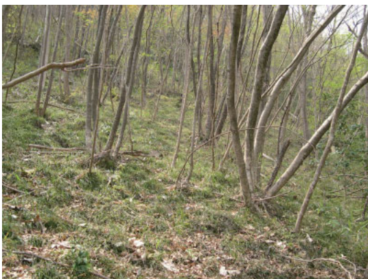
春の鎌倉山の明るい林内（茂木町 4月）

夏から秋にかけて、涼しい木陰の中にある遊歩道の脇では、鮮やかな朱色のタマゴタケ、落葉樹のクヌギやコナラには、樹液を求めるオオムラサキ、ゴマダラチョウ、カブトムシ、クワガタムシ類を見ることができる。