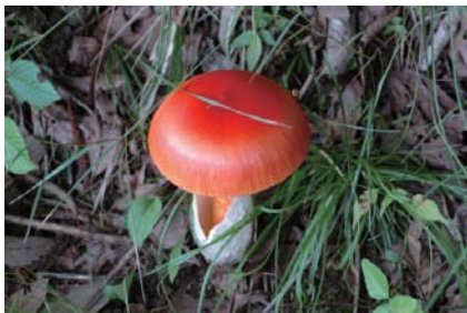
タマゴタケ (テングタケ科)