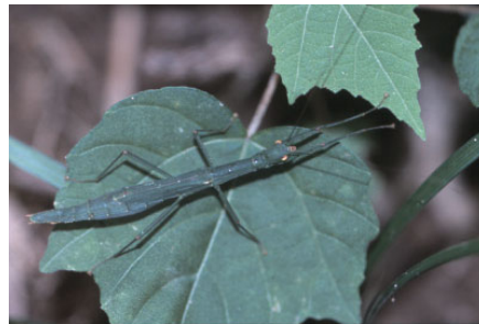
ヤスマツトビナナフシ (ナナフシ科)