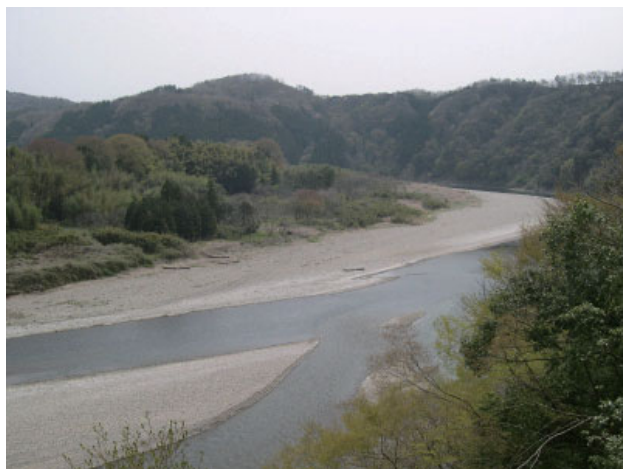
鎌倉山からの眺め（茂木町 4月）