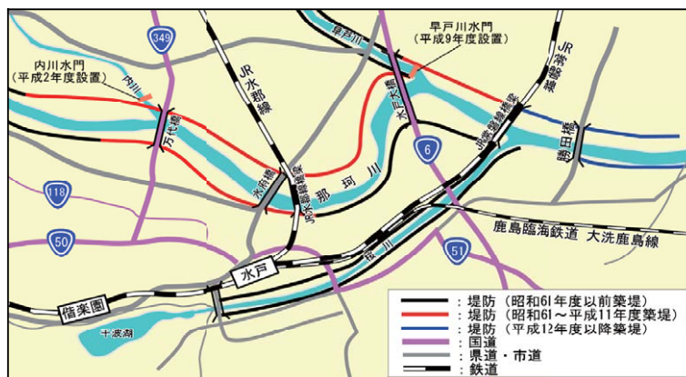
図3-12 近年（昭和61年以降）行われた那珂川下流部の治水事業の状況