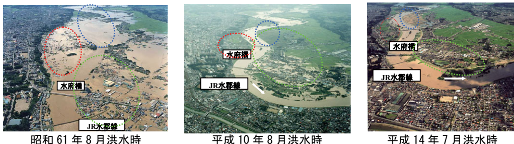
図3-13 洪水時の水戸市水府橋周辺の状況

各洪水の規模が異なるため一概に言えないが、昭和61年（1986）以降の一連の堤防整備を進める中で、昭和61年（1986）洪水に比べ平成10年（1998）、平成14年（2004）洪水では浸水区域面積、浸水被害戸数ともに軽減が見られた。