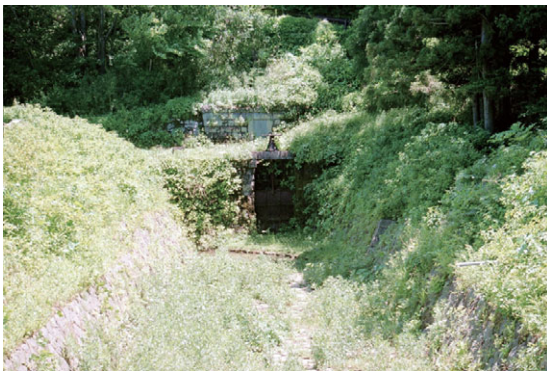
第二次取入口からの導水路および水門、隧道口

疏水取入口是那珂川の流れの変化で明治 38 年（1905）第一次取入口から 200m 上流に移され、導水路を経て隧道に入った（第二次取入口）。大正 4 年（1915）には旧（第一次取入口）取入口にもどった（第三次取入口）。