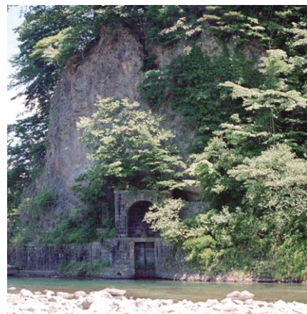
第一次、第三次取入口水門