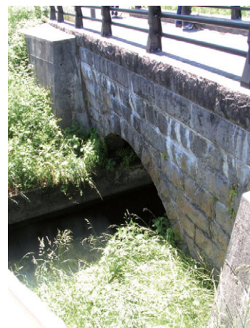
疏水橋—石積アーチ（水路）

疏水取入口是那珂川の流れの変化で明治 38 年（1905）第一次取入口から 200m 上流に移され、導水路を経て隧道に入った（第二次取入口）。大正 4 年（1915）には旧（第一次取入口）取入口にもどった（第三次取入口）。