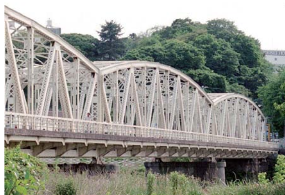
図 2-30 水府橋（水戸市）

なお，この水府橋は那珂川洪水対策工事に伴い，新しい橋に付け替えられることになっている。