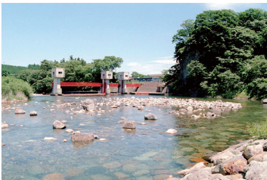
疏水取入口全景（西岩崎頭首工）

疏水の土木遺産としては、(元)第一次取水隧道—石ポータル、(旧)第二次取水路隧道、水門—石造（切石布積 きりいしぬのづみ ）、(旧)第三次取入口水門—石水門（切石布積）、疏水橋—石積アーチがある。これらの旧取水施設と疏水橋は、国の重要文化財に指定されている。