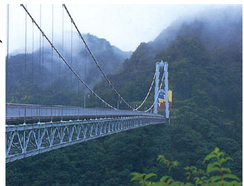
竜神大吊橋(常陸太田市)

長さ375m。竜神ダムをまたぐようにつけられた、歩行用としては日本一長い吊り橋。高さ100mの橋の上からは、遠く阿武隈・八溝山系の山並や美しい自然に囲まれた素朴な山田川上流の風景を見ることができる。