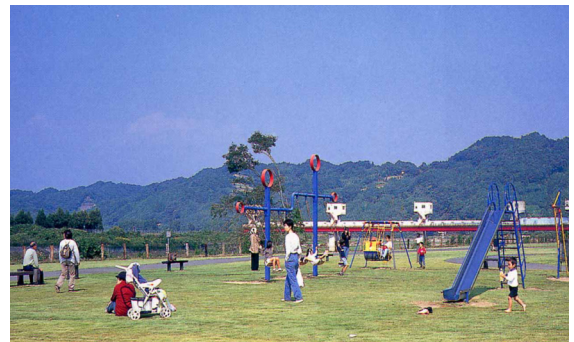
辰ノ口親水公園（常陸大宮市）

豊かな久慈川の流れに加え、辰ノ口堰とその周辺の自然と環境の特性を生かした総面積約34haの公園である。サケ展示館、桜つつみ、トリム広場、BMXコース、さらに高さ29mの展望台などがあり、家族そろって一日のんびり過ごすことのできる公園である。