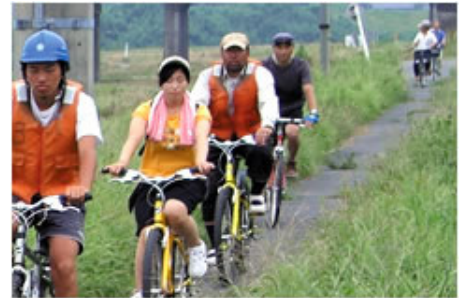
サイクリングロード

サイクリングロードは久慈川大橋のたもとを起点とし、本流と支流・山田川の堤防の上を進み、常陸太田市の山田川に架かる国道293号常井橋のふもとを終点とする。