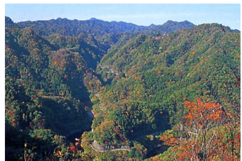
竜神峡(常陸太田市)

竜神峡は、原生林の中を流れる山田川の支流・竜神川に沿って、十数kmにわたって断崖絶壁が続くV字型の渓谷である。四季折々の渓谷美は、茨城観光百選にも選ばれている。