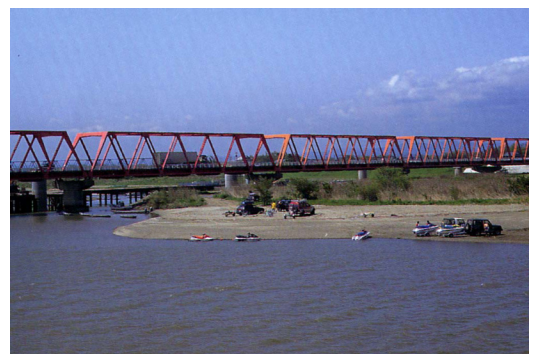
河口部の水面利用（日立市）