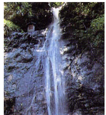
菅谷不動尊の滝(常陸太田市)

支流里川の上流には、菅谷不動尊の滝や雌滝・雄滝をめぐるハイキングコースがあるほか、折橋地区の下滝、大小の滝や早瀬などが村内各所にあり、山と清流が織りなす自然美を見ることができる。