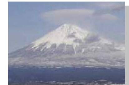
12月 雁堤から見た富士山