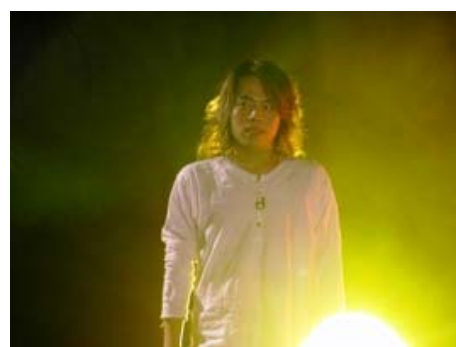
▲「おはなしのくに」撮影風景