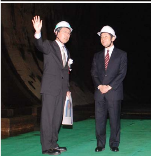
第三立坑で地下約50m のトンネルご視察状況