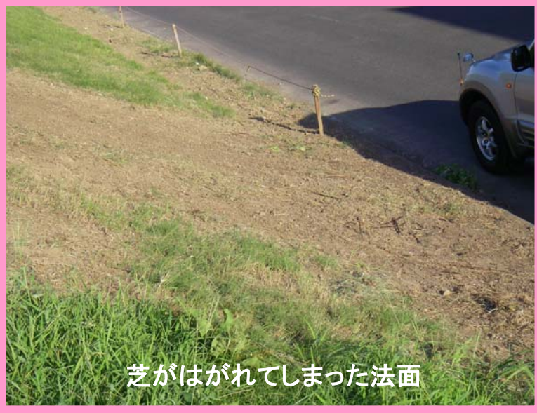
芝がはがれてしまった法面

芝が根付く前に人が立ち入ると、右の写真のように芝ははがれてしまい堤防本来の機能が発揮できなくなってしまいます。近隣地域の皆様にはご迷惑をおかけいたしますが、ご理解・ご協力の程、よろしくお願いいたします。