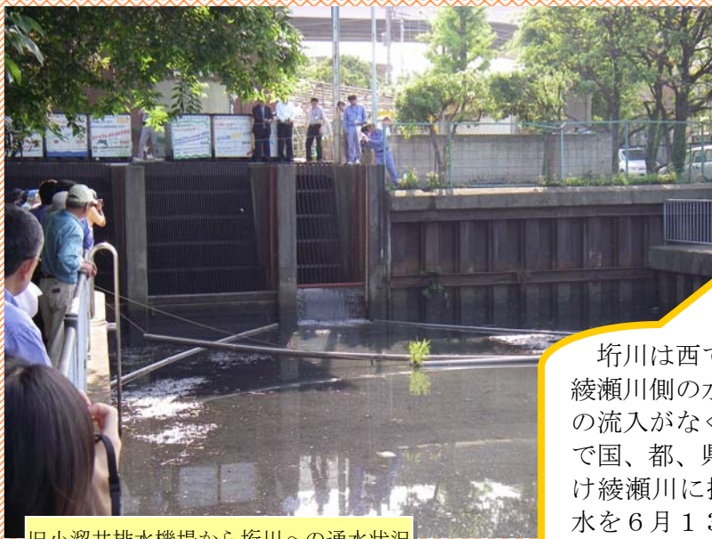
旧小溜井排水機場から堀川への通水状況