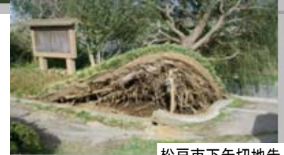
松戸市下矢切地先