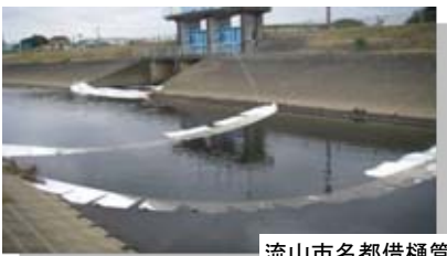
流山市名都借樋管

10月13日夜、坂川に流入する名都借幹線で大量の油を確認。流山市がオイルフェンスを設置し、松戸出張所でも坂川放水路や新坂川で対策を実施。現在も油を吸い取るマットにて回収を実施中。事故が発生すると昼夜を問わず、発生源調査や流出対策を実施しています。