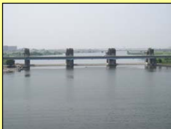
ゲートが閉まっている状態