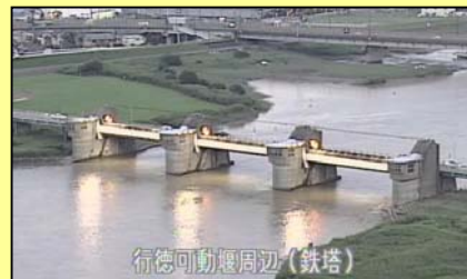
ゲートが開いている状態