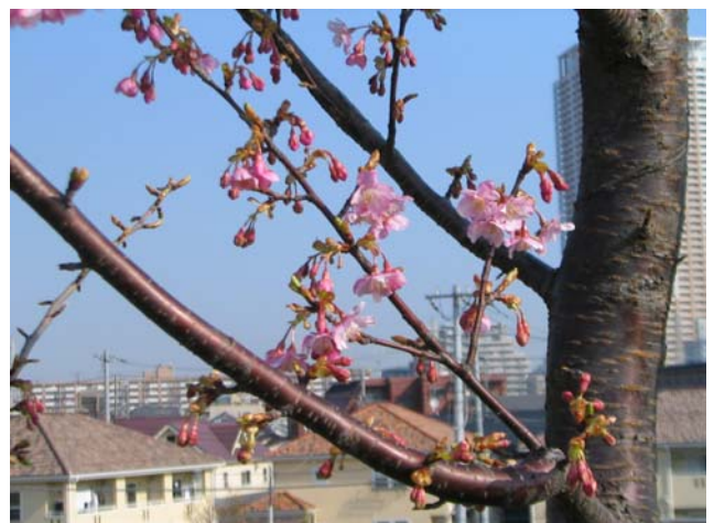
(昨年2月3日に市川南の堤防で撮影)