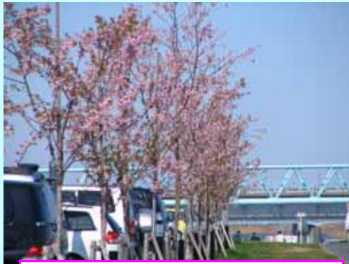
妙典スーパー堤防の河津桜(平成19年2月)

市川市の江戸川桜並木(妙典スーパー堤防、市川南地先)では、早咲きの「河津桜」が2月上旬から咲き始めます。