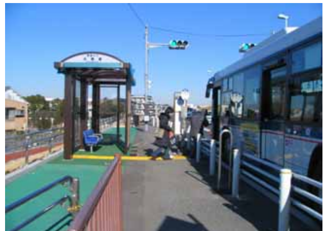
江戸川区北篠崎のバス停 (上屋が設けられ車イスでも乗り降りが)