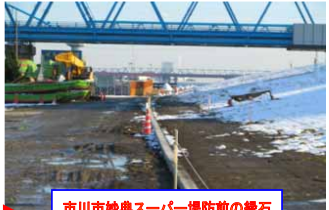
市川市妙典スーパー堤防前の縁石