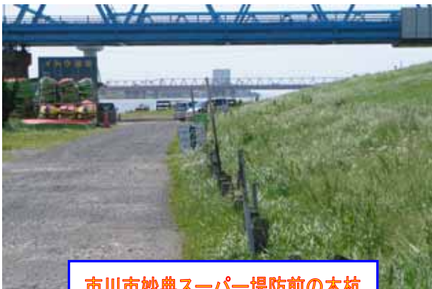
市川市妙典スーパー堤防前の木杭

左の写真は、去年3月に「江戸川さくら並木整備事業植樹式」を行ったところで作った階段です。中央の写真は、市川市妙典スーパー堤防前の木杭を縁石に変えている様子です。下の写真は、江戸川区北篠崎のバス停をより使いやすくしたもので、緑色とあずき色の部分は江戸川河川事務所が整備し、上屋とバス停は江戸川区が整備し、車イスでもバス停の乗り降りができるようになりました。