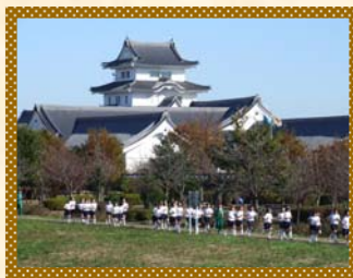
H20/11/20(木) 関宿中学校 マラソン大会

河川は基本的に自由に使用できますが、多人数で使用する場合、情報として出張所にて「一時使用届」を提出して頂いております。任意ではありますが、この届出により、他の利用者と重なっていないか、又、工事車両の出入り等で危ない場所ではないか？等の確認及び調整を行っています。