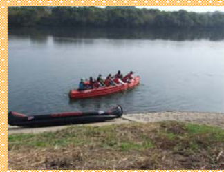
H20/11/15(土) 地域交流センター Eポートイベント