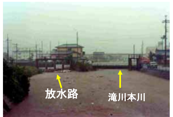
昭和56年8月23日(台風15号):放水路分水地点