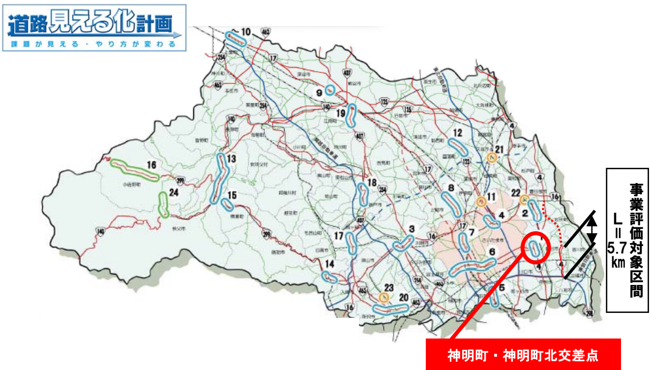
図 埼玉県移動性見える化プランにおける渋滞ポイント

今回の事後評価は、平成16年に開通しました八潮市八條 やしおしはちじょう ～吉川市川藤 よしかわしかわ までの5.7kmの区間が対象です。