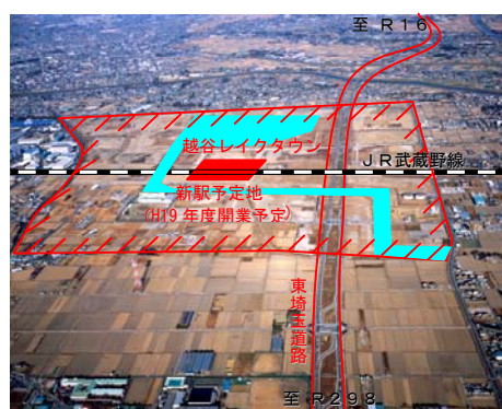
越谷レイクタウン付近