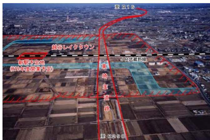
事業化区間現況(越谷レイクタウン付近)