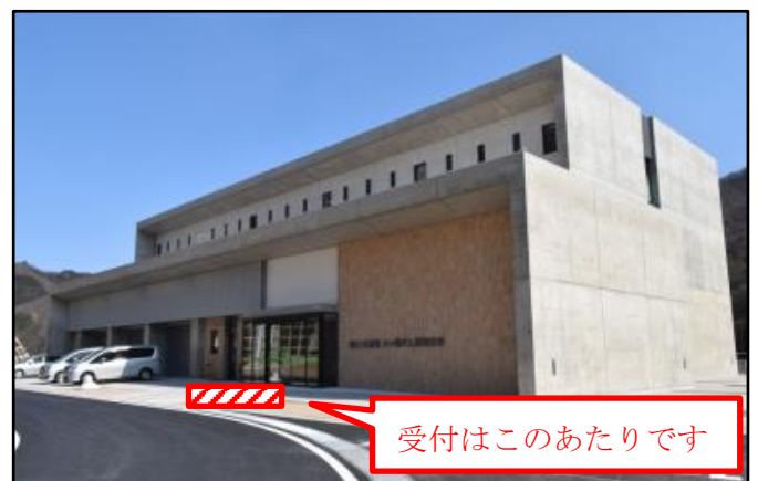
なるほど！やんば資料館