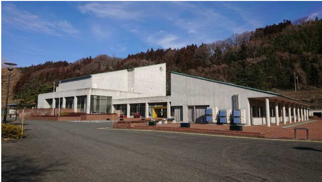
みなかみ町カルチャーセンター案内図